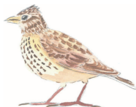
Alouette des Champs