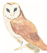
La Chouette effraie